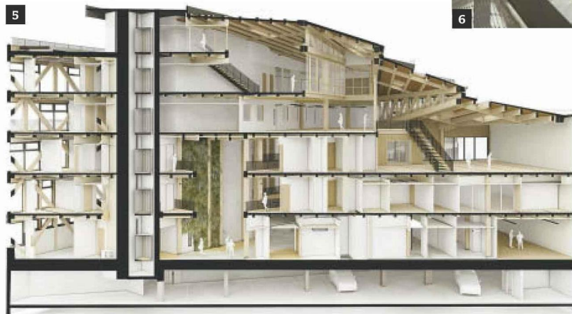
VINCENT LAVERGNE ET ATELIER WOA

➔ Maitrise d'ouvrage: ONF. Maitrise d'œuvre: Vincent Lavergne Architecture Urbanisme (VLAU) et Atelier WOA, architectes. BET: Egis (fluides, thermique), Acoustb (acoustique), Elioth (structure, environnement). Principales entreprises: City Construction (gros œuvre), Mathis (charpente bois et métal). Surface: 7650 m 2 SP. Coût des travaux: 24,5 M€ HT. Livraison: juin 2022. Inauguration: novembre 2022.